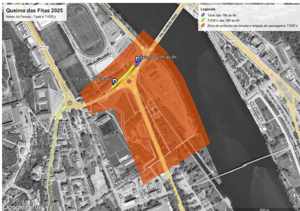
Imagem 2 – Tomada e Larga de passageiros de Táxis e TVDE,s