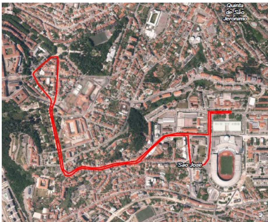
Zona de passagem dos atletas da caminhada

Para os devidos e legais efeitos emite-se e publica-se o presente Edital, que vai assinado digitalmente e outros de igual teor que serão publicitados nos painéis eletrónicos disponibilizados no Átrio dos Paços do Concelho, nas sedes das Juntas de Freguesia do Município de Coimbra, na página eletrónica da Câmara Municipal ( www.cm-coimbra.pt ) e nos demais lugares do uso e costume.