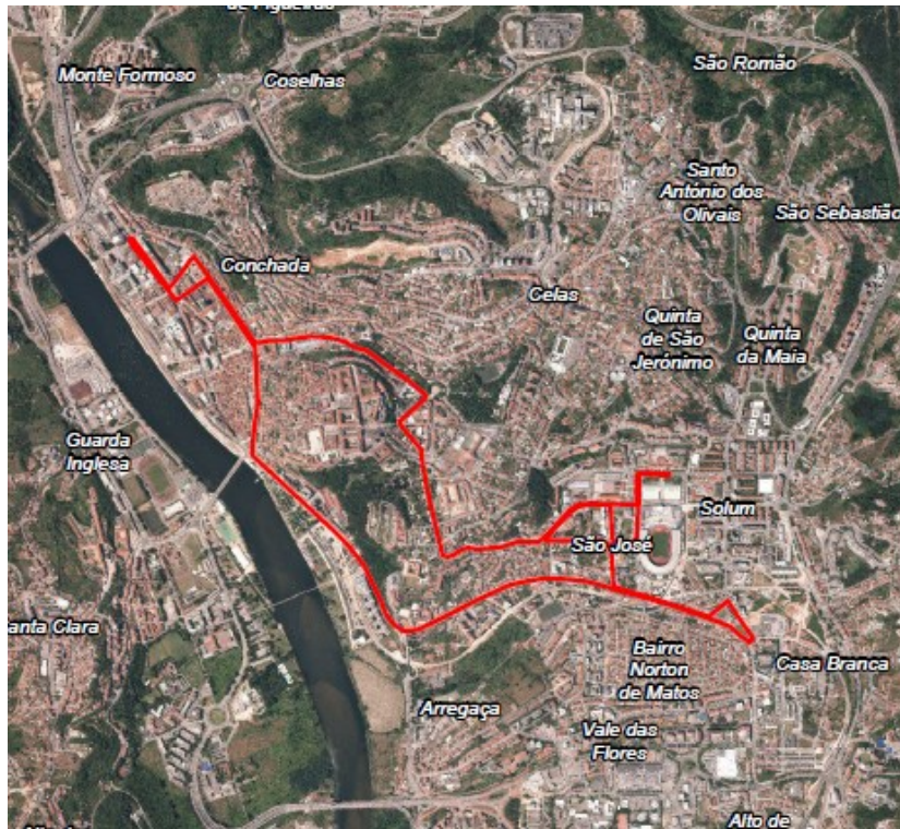
Zona de passagem dos atletas

Grande Guerra, Rua General Humberto Delgado, Rua D. Manuel I e chegada na Rua Infanta D. Maria.