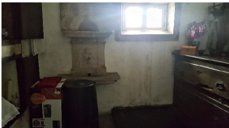
Fotos do edifício existente