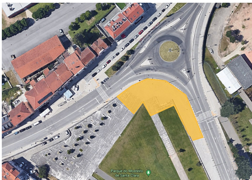
Imagem 1: A amarelo a venda permitida pelo número 2 acima referido.