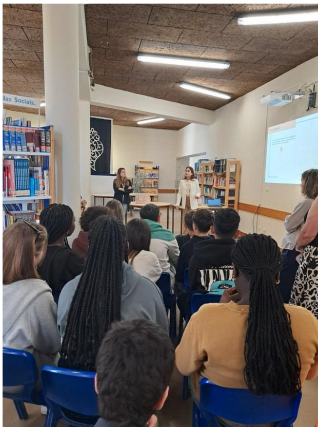
Figura 8. Evidência Ação de Informação e Sensibilização EB 2/3 de Eixo