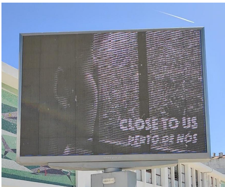
Figura 6. Participação da CM da Nazaré na Campanha de 18 de outubro