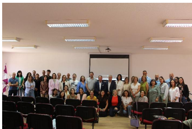
Figura 2. Reunião da RRCAPVTSH de junho de 2025