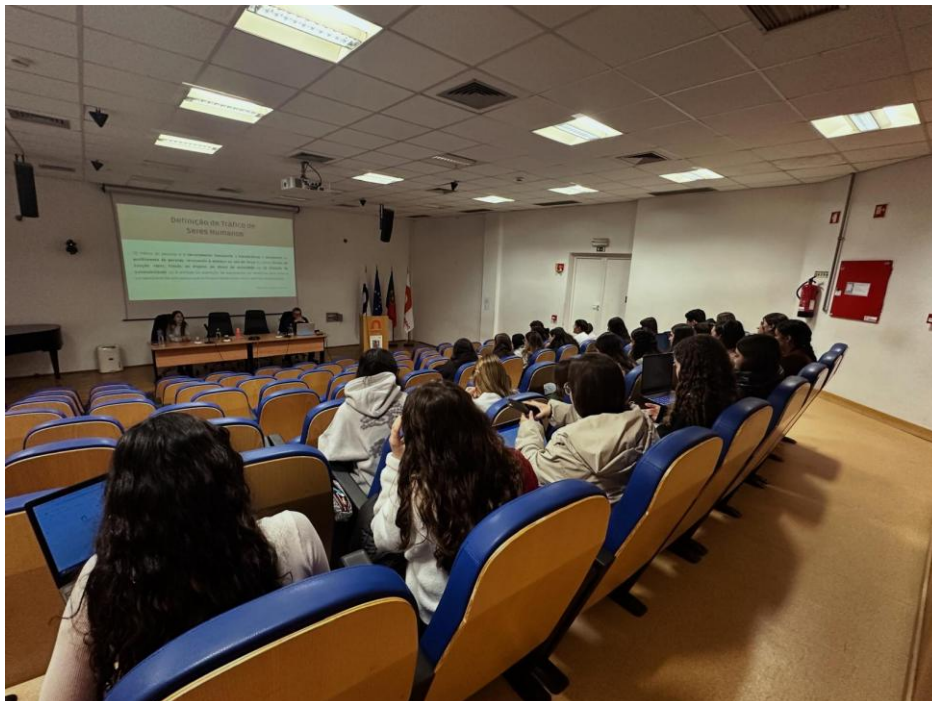
Figura 11. Evidência Ação de Sensibilização dinamizada na Escola Superior de Educação de Coimbra