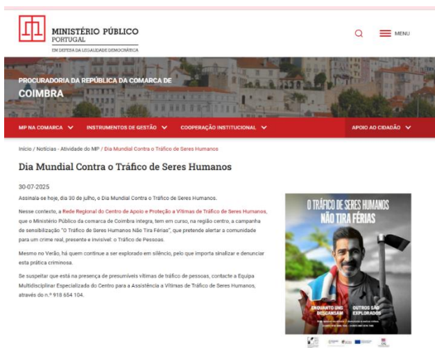
Figura 5. Participação do MP de Coimbra na Campanha de 30 de julho