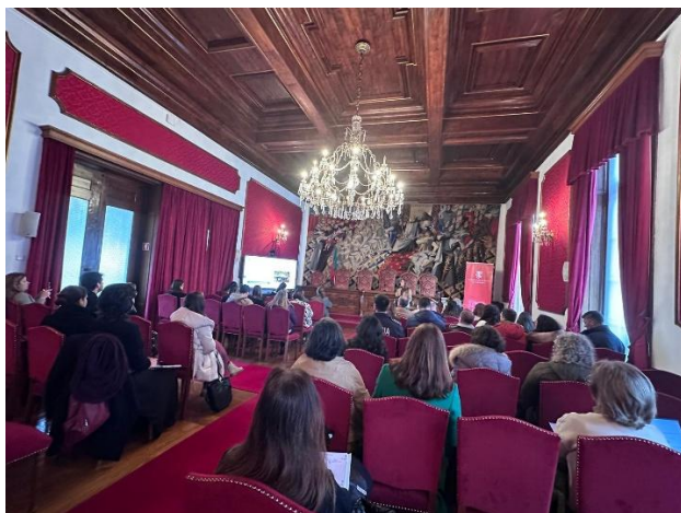
Figura 1. Reunião da RRCAPVTSH de fevereiro de 2025