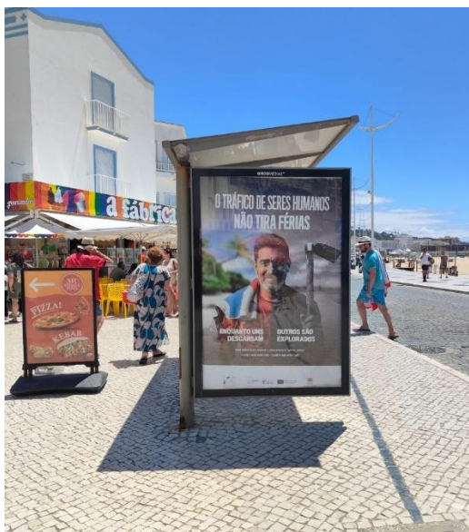
Figura 4. Participação da CM da Nazaré na Campanha de 30 de julho