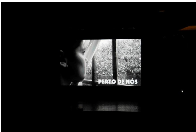
Figura 7. Participação da CM de Seia na Campanha de 18 de outubro