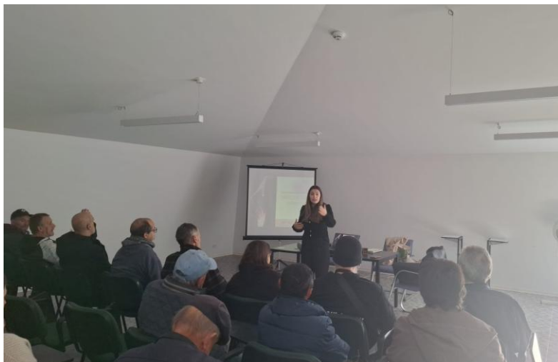
Figura 9. Evidência Ação de Informação e Sensibilização na Cáritas Diocesana de Aveiro