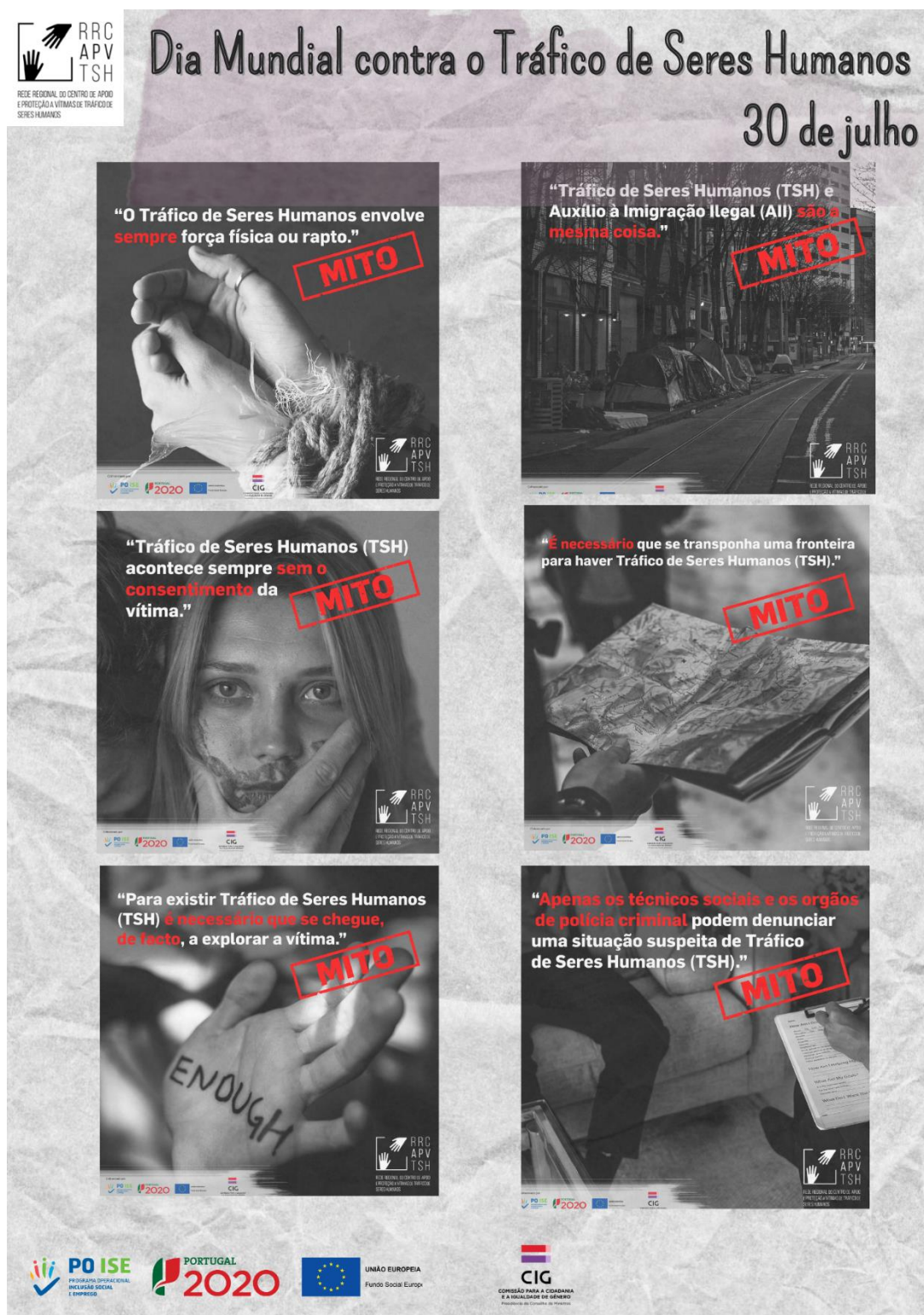
Imagem Final de divulgação no Dia Mundial Contra o Tráfico de Seres Humanos