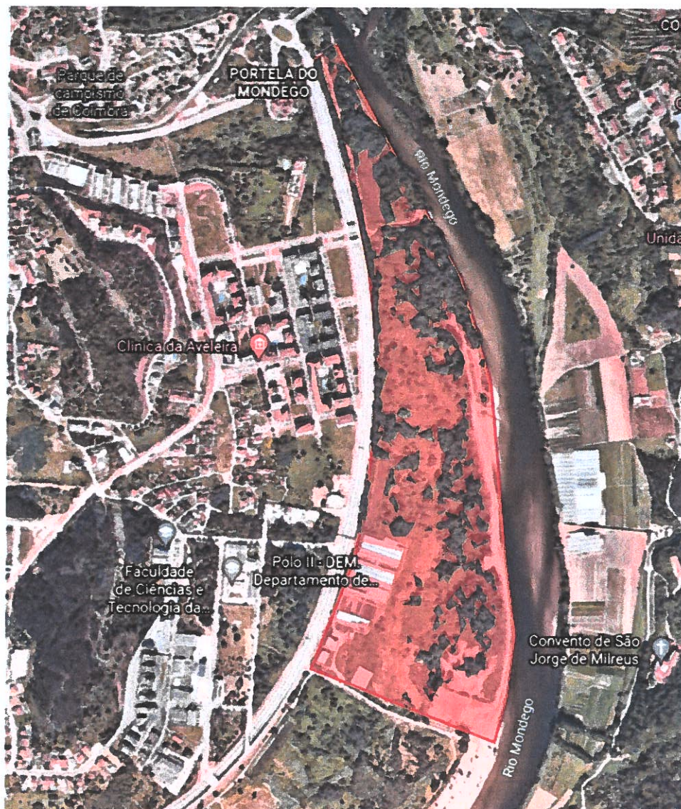
Fig. 1 – Planta das áreas com restrições.

Para constar e para os devidos e legais efeitos emite-se o presente Edital, que vai assinado e devidamente autenticado com o selo branco, a publicar nos termos legais nos Paços do Município, nas Juntas de Freguesia, na página eletrónica da Câmara Municipal ( www.cm-coimbra.pt ) e nos demais lugares do uso e costume, devendo ser dado conhecimento às forças de segurança.