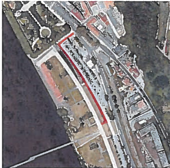
Zona de passagem de atletas