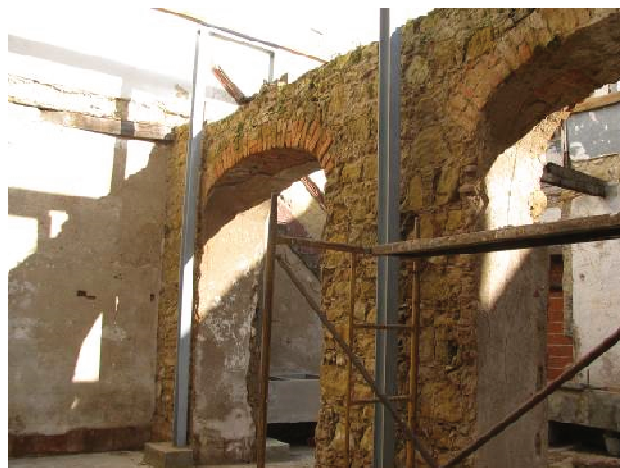
Figura 03 – Sondagem parietal 1