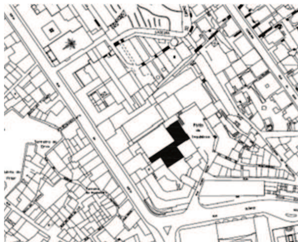
Figura 01 – Localização do espaço em estudo em cartografia 1/1000

O presente resumo refere-se aos trabalhos arqueológicos efetuados, em 2018, num “Edifício sito no Largo Adjacente ao Pátio da Inquisição”. O local da intervenção localiza-se na União das Freguesias de Coimbra (Sé Nova, Stª Cruz, S. Bartolomeu e Almedina), concelho e distrito de Coimbra. Este edifício encontra-se totalmente inserido no conjunto da Universidade de Coimbra – Alta e Sofia inscrito na Lista do Património Mundial no dia 22 de junho de 2013 (decisão 37COM8B.38 do Comité do Património Mundial), publicitada através do Aviso n.º 14917/2013, D.R. n.º 236, 2ª série, de 5 de dezembro.