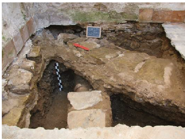
Figura 02 – Plano final da sondagem 2

Relativamente às sondagens parietais observou-se apenas um aparelho construtivo idêntico, composta por alvenaria irregular de pedra calcária interligada por argamassa. Uma vez que apenas existiam paredes estruturais na habitação, é natural que este resultado advenha dessa situação. Ressalva-se, no entanto, a picagem da arcaria (sondagem parietal 1), que dividia o piso térreo. Esta revelou a constituição de um aparelho irregular com pedras de pequenas/médias dimensões, tijolos e alguns elementos de madeira. O fecho dos arcos é fundamentalmente feito em tijolo e pontualmente com pedras calcárias. Dois dos arcos são mais pequenos e com uma curvatura menos acentuada na parte superior, enquanto o existente mais a Sul, possui uma maior altura e é mais arredondado. Os tijolos que compõem a estrutura são maciços e de diferentes proporções. Os elementos construtivos encontram-se agregados por uma argamassa de reboco, semi-compacta, grão miúdo e com uma tonalidade bege. Pontualmente por cima do “esqueleto” principal da construção surgia uma espécie de isolante de tom negro, incrustado em certas pedras e tijolos. Aparenta ser algo semelhante a pez (substância negra e gordurosa obtida a partir da destilação do alcatrão), que serviria talvez para impermeabilizar.