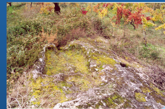
Salgadeira dos Mouros / Outeiro