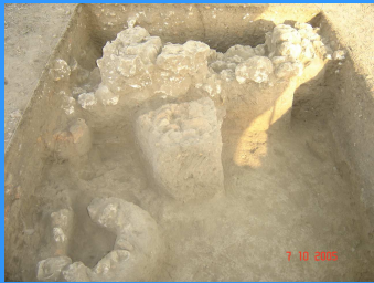
Sondagem – Amoreira / S. Martinho de Árvore

Estes instrumentos de gestão do património encontram-se internamente sob protecção legal no Regulamento Municipal de Edificação Urbana – RMUE, efectuados com o intuito de despoletar mecanismos de avaliação e actuação preventiva.