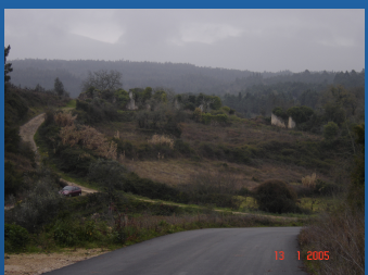
Invibora - Cernache