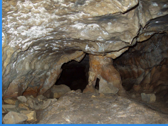
Gruta dos Mouros - Souselas