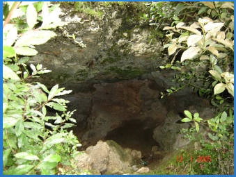
Abrigos - Cernache