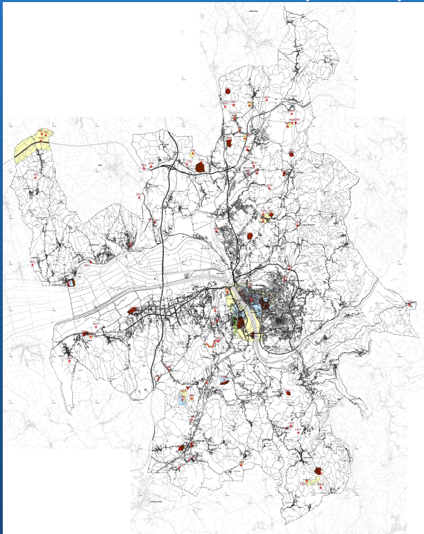
Mapa do Concelho – Sítios com Potencial Arqueológico