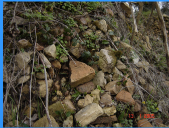
Moroços – Vale S. Silvestre / Palheira