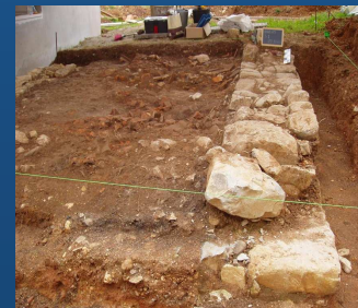
Sondagem – Antigo / Vilela