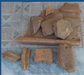
Fragmentos de tegulae e pesos de tear – Lomba da Moura / Libal Pinto