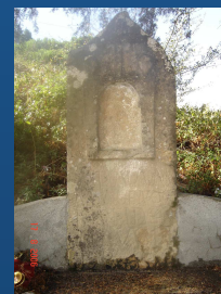
Alminha - Assafarge