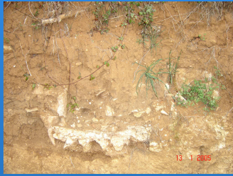
Opus Signinum – Escoural / Cernache