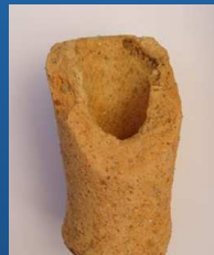
Fundo de Ânfora – Mouros / Marmeleira