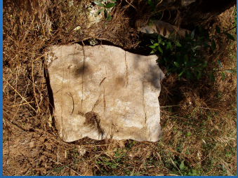
Cemitério Visigótico – Carrizes / Souselas