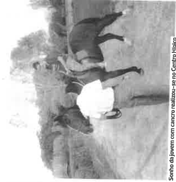
Sonho da jovem com cancro realizou-se no Centro Hípico