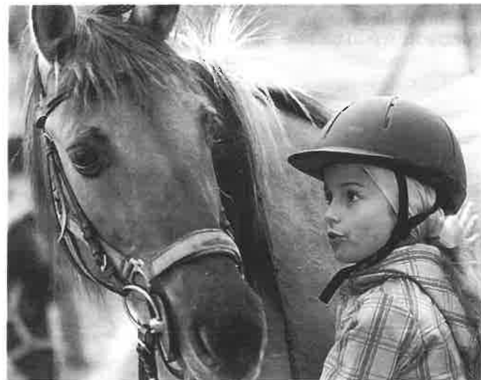
Os alunos estabelecem uma relação estreita com os cavalos

Ao mesmo tempo que crianças e jovens aprendem a arte equestre, desenvolvem outras competências emocionais, pois aprendem a lidar com os animais e com o cavalo, em particular, «tendo em conta que é preciso muito mais do que ape-