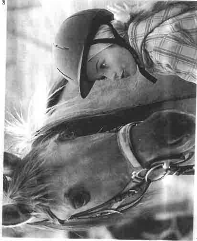
Os alunos estabelecem uma relação estreita com os cavalos

Ao mesmo tempo que crianças e jovens aprendem a arte