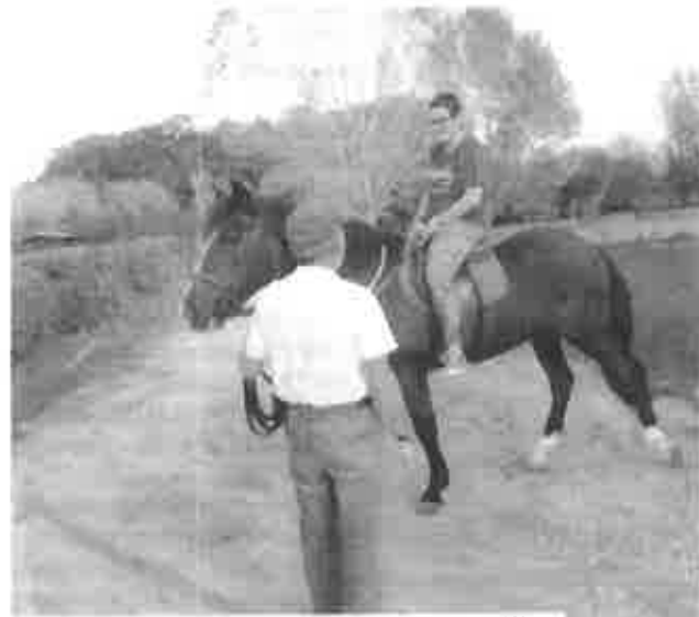
Sonho da jovem com cancro realizou-se no Centro Hípico