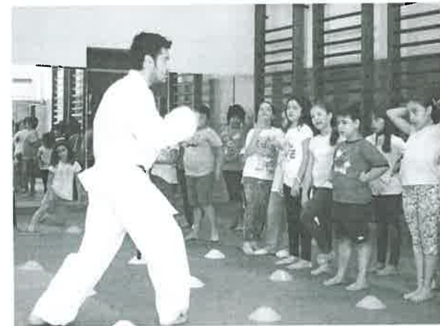
Sessão de Divulgação da modalidade no "Dojo" da Agrária