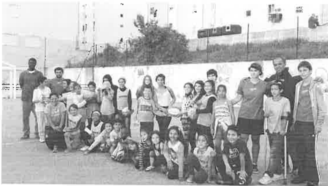
1º Treino do Projeto Rugby no Bairro – 22-04-2015