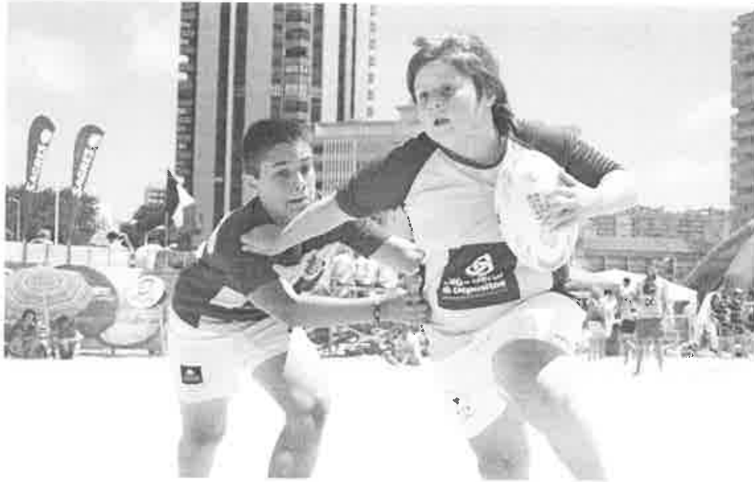
Jovem atletas no Torneio Internacional Beach Rugby da Figueira da Foz