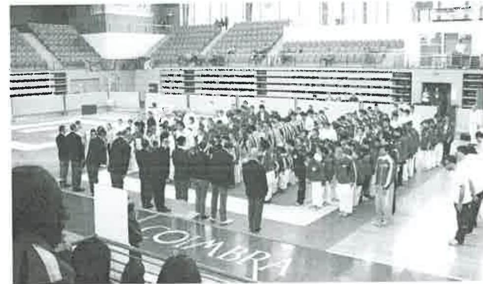
Participação em Estágio Nacional

ATINGIDO. Foram efetuadas duas reuniões entre os mestres do clube.