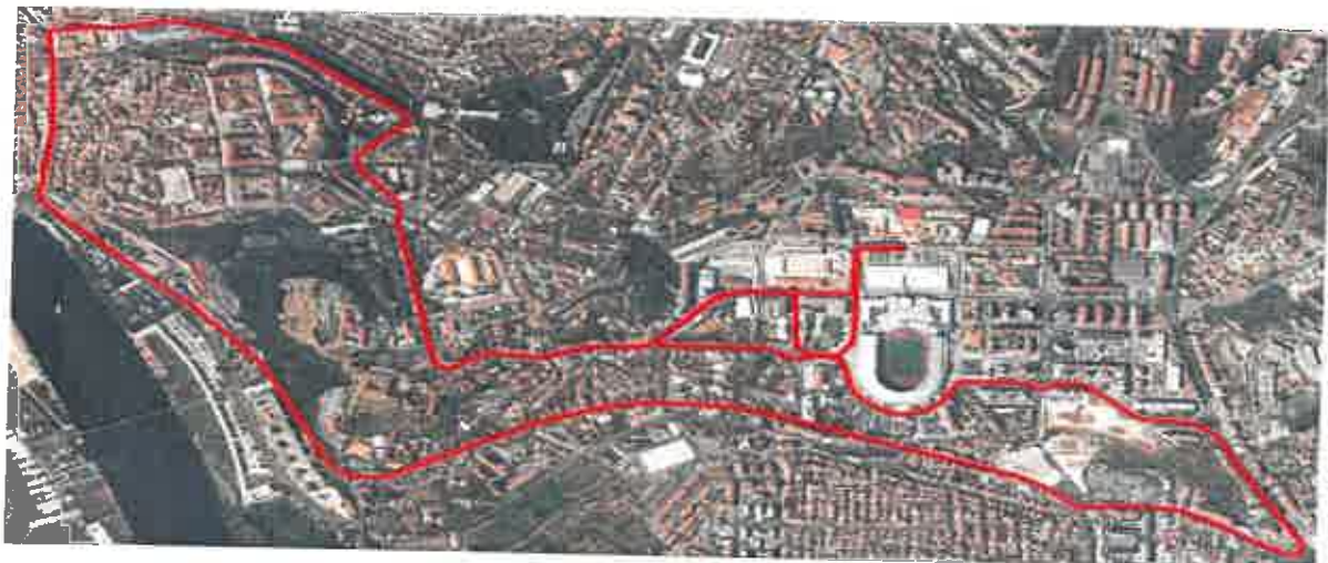
— TRAÇADO DA CORRIDA PRINCIPAL – 10KM

Partida da Rua Infanta D. Maria, Rua D. Manuel I, Rua General Humberto Delgado, Rua Combatentes da Grande Guerra, Rua D. Manuel I, Rua Jorge Anjinho, Rua Fernando Namora, Rua da Casa Branca, Rua do Brasil, Avenida Emídio Navarro, Rua Ferreira Borges, Rua Visconde da Luz, Praça 8 de Maio, Rua Olímpio Nicolau Rui Fernandes, Avenida Sá da Bandeira, Rua Oliveira Matos, Rua Castro Matoso, Alameda Dr. Júlio Henriques, Rua dos Combatentes da Grande Guerra, Rua D. Manuel I e chegada à Rua Infanta D. Maria.