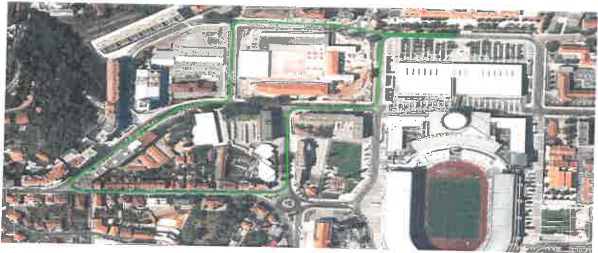
TRAÇADO DA MINI S. SILVESTRE – TRAÇADO II

Rua Infanta D. Maria, Rua António Leitão I, Rua General Humberto Delgado, Rua dos Combatentes da Grande Guerra, Rua Brotero, Rua General Humberto Delgado, Rua D. Manuel I e Rua Infanta D. Maria.