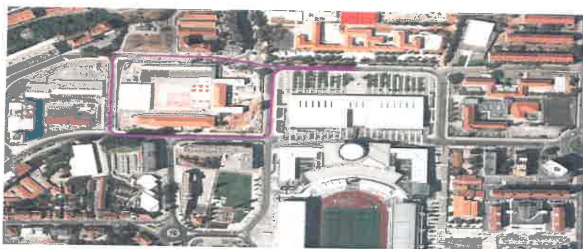
— TRAÇADO DA MINI S. SILVESTRE – TRAÇADO I

Partida da Rua Infanta D. Maria, Rua António Leitão, Rua General Humberto Delgado (sentido ascendente), Rua Combatentes da Grande Guerra (sentido descendente), Rua Avelar Brotero, Rua General Humberto Delgado (sentido descendente), Rua D. Manuel I (sentido ascendente) e Rua Infanta D. Maria.