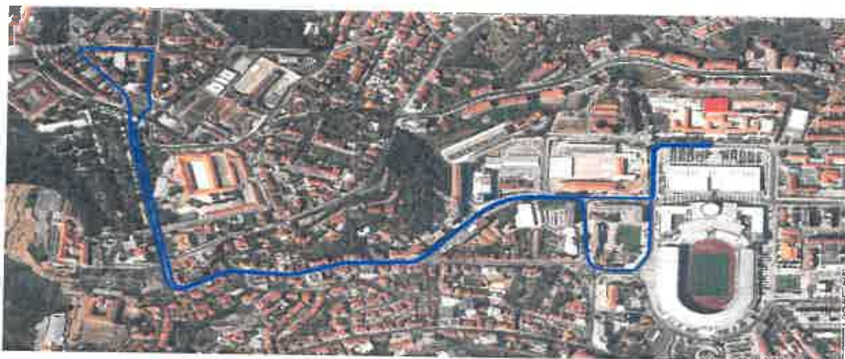
— TRAÇADO DA CAMINHADA

Partida da Rua Infanta D. Maria, Rua D. Manuel I, Rua General Humberto Delgado, Rua Combatentes da Grande Guerra, Alameda Dr. Júlio Henriques, Rua Alexandre Herculano, Rua Oliveira Matos, Rua Castro Matoso, Alameda Dr. Júlio Henriques, Rua dos Combatentes da Grande Guerra, Rua D. Manuel I e chegada à Rua Infanta D. Maria.