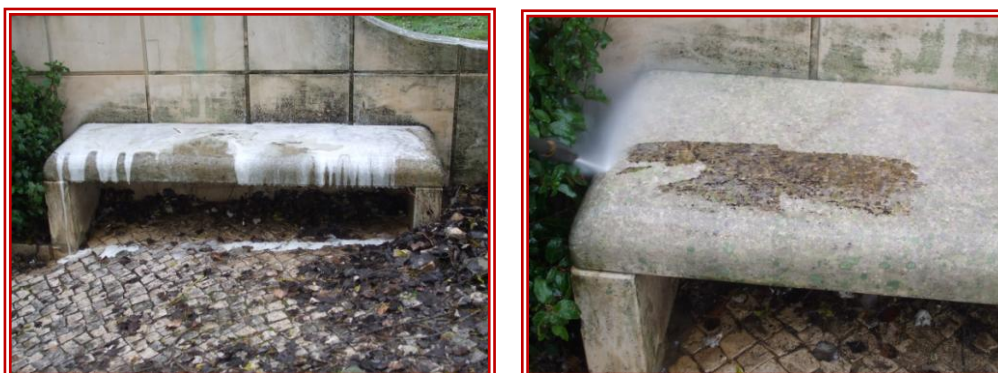
Fig. 4 e 5 – Aplicação do biocida e sua remoção com água pressurizada.