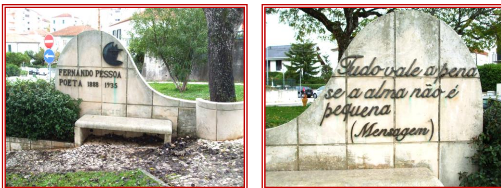
Fig 6 e 7 – Aspetos gerais depois da intervenção