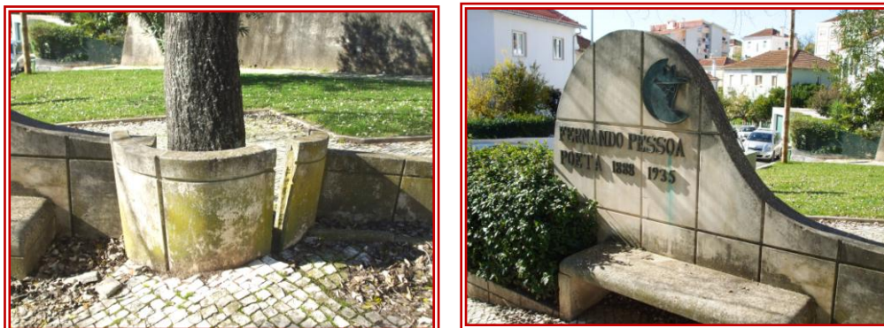
Fig 2 e 3 – Aspetos gerais de pormenor, antes da intervenção