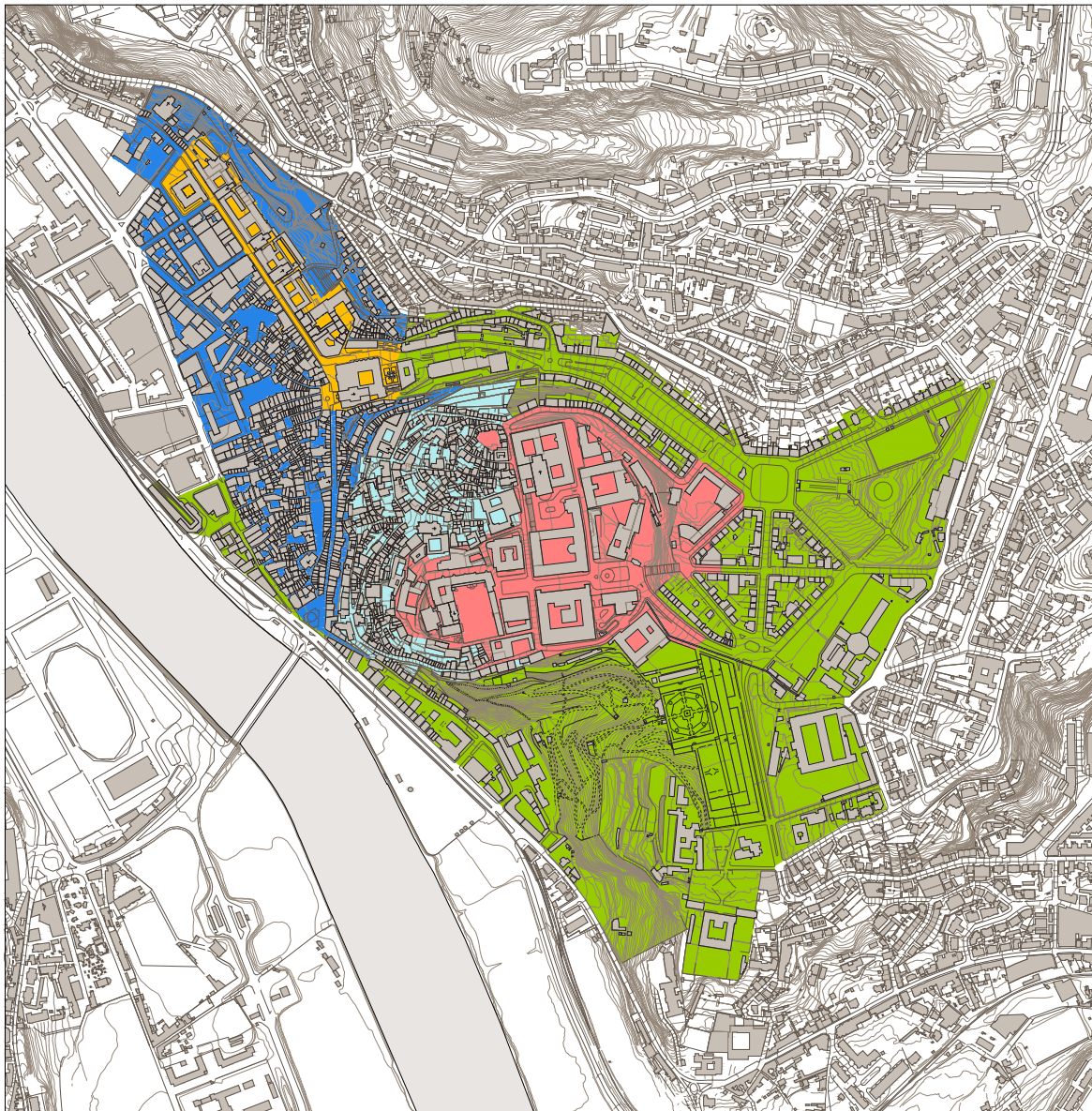
Carta nº 2 - Planta das zonas sujeitas a regras específicas