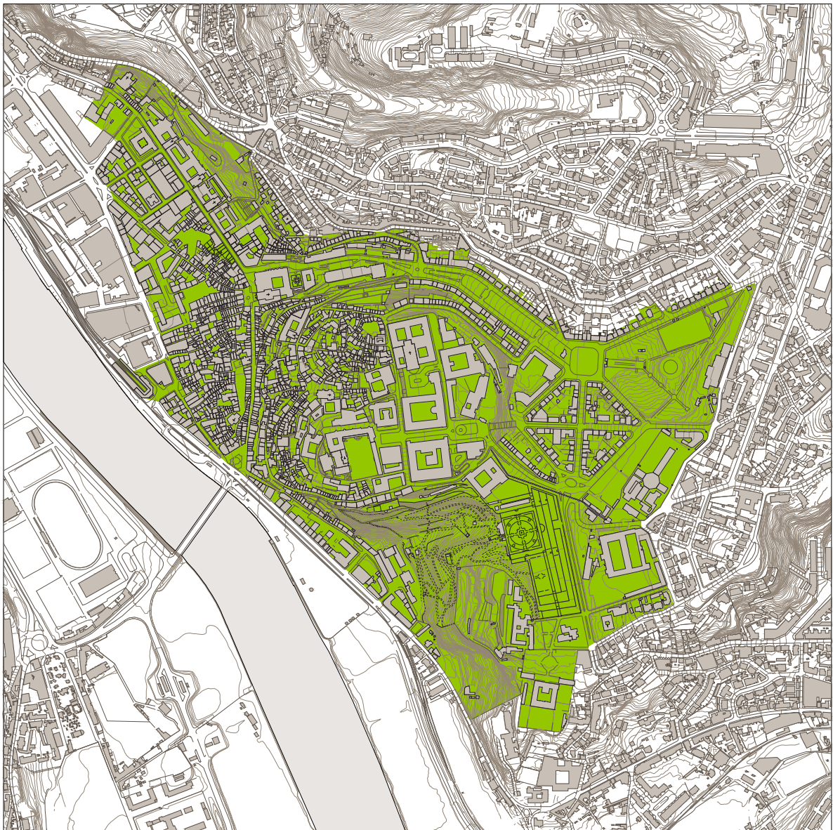
Carta nº 1 - Planta da Área afectada ao Regulamento