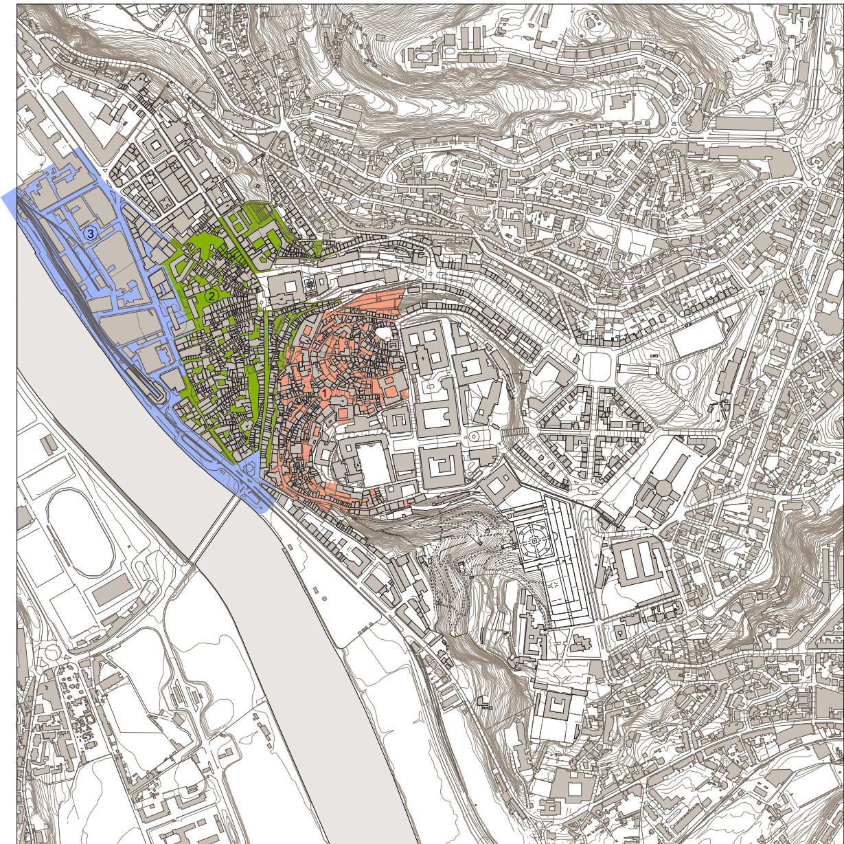
Carta nº 3 - Planta de Identificação das Áreas de Reabilitação Urbana