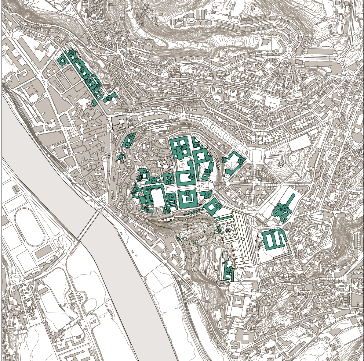
Carta nº 4 - Planta de Identificação dos Edifícios